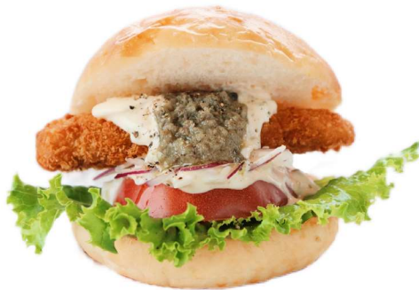
フィッシュバーガー

甌島が誇る200m級の断崖をイメージしたハンバーガーです。上甌島のきびなごをフリットに、下甌島のたかえびは白身魚と一緒にカツに。両島の名物を一度に楽しめます。食べ方は、ぎゅっと潰して思い切りがぶり！